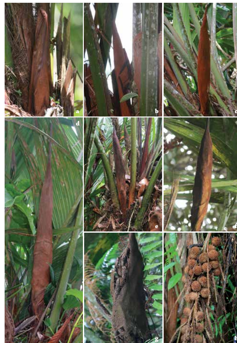
Figura 6. Desarrollo de la inflorescencia de cabecinegro ( Manicaria saccifera ). a) Inflorescencia cubierta con el prófalo fibroso, b) inflorescencia perdiendo el prófalo, c-d) inflorescencia con flores maduras en la parte interna, e-f) inicio de formación de frutos en la parte interna de la bráctea peduncular, g) frutos en formación y pérdida de la bráctea peduncular, h) frutos maduros, sin la bráctea peduncular.

Los ensayos realizados para evaluar el efecto causado por el corte de la bráctea no mostraron diferencias significativas en la formación de frutos. Se presentaron leves cambios en la biología floral, se incrementó la llegada de insectos