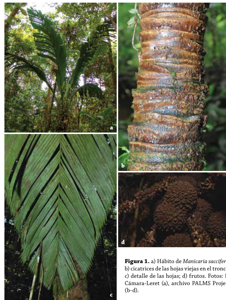
Figura 1. a) Hábito de Manicaria saccifera ; b) cicatrices de las hojas viejas en el tronco; c) detalle de las hojas; d) frutos.

Manicaria saccifera se distribuye irregularmente a través de la Costa Atlántica de Centro América desde Belice hasta Panamá y al norte de Sur América, en la Costa Pacífica y en la Amazonia de Colombia, Venezuela, Perú, y Brasil, Trinidad y las Guayanas (Galeano y Bernal 2010). Se encuentra a todo lo largo de la región Pacífica de Colombia (Antioquia, Chocó, Valle del Cauca, Cauca y Nariño) y se conoce de una sola localidad en el norte de Ecuador (Esmeraldas). En la región del Pacífico colombiano crece cerca al mar en tierras bajas y en planicies de inundación de ríos y quebradas hacia el interior (Henderson et al. 1995, Galeano y Bernal 2010).