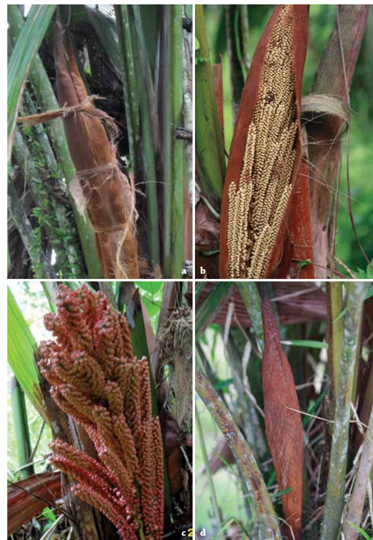
Figura 3. Experimento para evaluar el efecto del corte de la bráctea peduncular en el éxito reproductivo del cabecinegro ( Manicaria saccifera ). a) Recubierta (desmonte y monte de la bráctea peduncular); b) parcial (corte longitudinal de la bráctea peduncular); c) expuesta (retiro total de la bráctea peduncular); d) cubierta (bráctea sin intervención).

La extracción del cabecinegro se realiza de las poblaciones silvestres. La técnica de cosecha involucra el corte de toda la inflorescencia, la cual se hala con una vara llamada “garabato” y se corta con machete, para luego extraer cuidadosamente la fibra o bráctea peduncular y desechar inmediatamente en campo el resto de la inflorescencia (Figura 4). La cosecha más importante se da entre marzo y mayo, cuando un recolector puede extraer en cinco horas de trabajo hasta 100 brácteas. El tiempo dedicado a esta actividad en la semana está entre dos y tres días durante la temporada de alta cosecha; el resto del año cosechan de acuerdo a la demanda. El tamaño de las inflorescencias cortadas