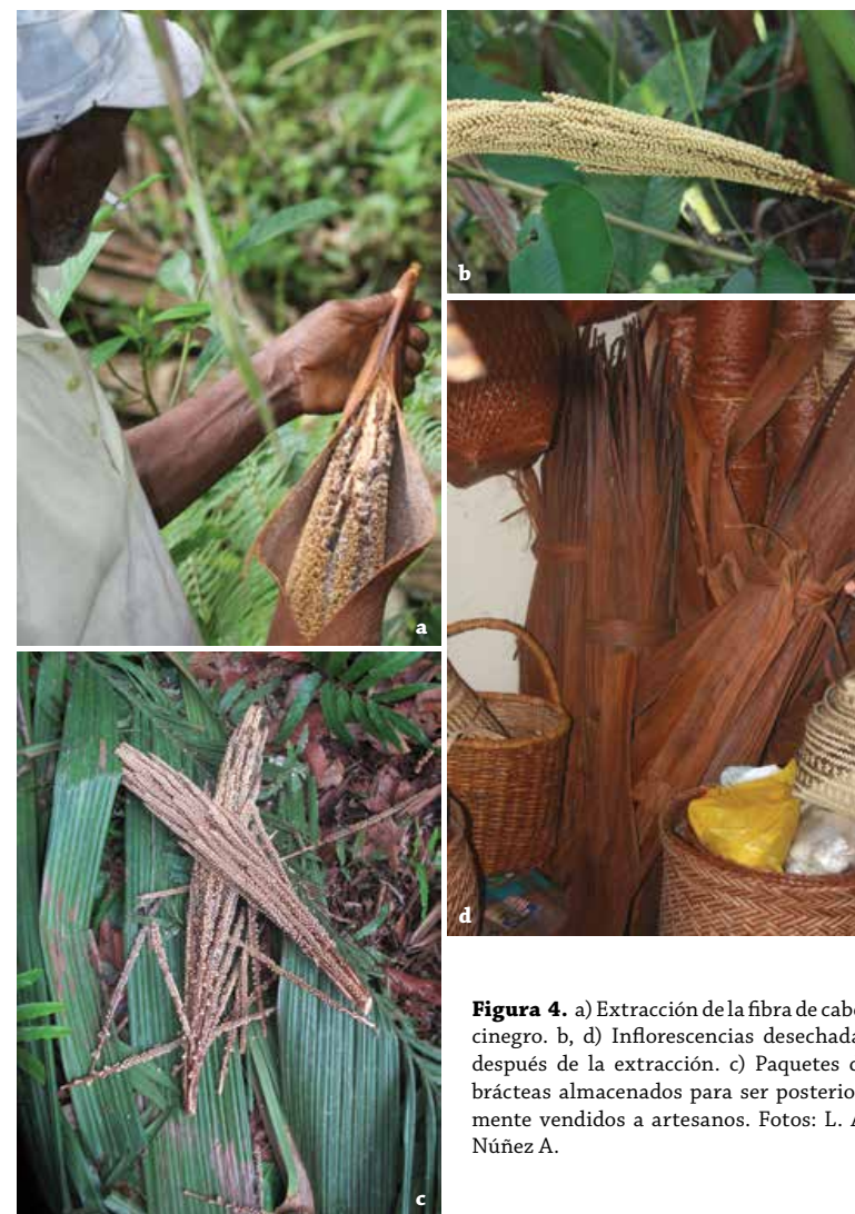
Figura 4. a) Extracción de la fibra de cabecinegro. b, d) Inflorescencias desechadas después de la extracción. c) Paquetes de brácteas almacenados para ser posteriormente vendidos a artesanos.

Los dos sitios de muestreo difieren en el número total de estructuras reproductivas (inflorescencias/infrutescencias) por individuo ( K-S = 3.840 ; p < 0.0001 ). La mayoría de los individuos presentó 1 (56%), seguidos por los individuos que tuvieron 2-3 (40%), y en menor proporción los individuos con 4 y 5 (1.6% cada una). Por su parte, en el sitio de cosecha el 80,6% de los individuos tuvo 1 estructura, 13,1% tuvo 2 y sólo el 6% tuvo entre 3 y 5 estructuras. Mientras que en el número de inflorescencias/infrutescencias para cada palmar, se encontró un promedio de 0,6 infrutescencias y 1,1 inflorescencias por adulto en el sitio cosechado y 0,9 infrutescencias y 0,3 inflorescencias por adulto en el sitio de no cosecha.