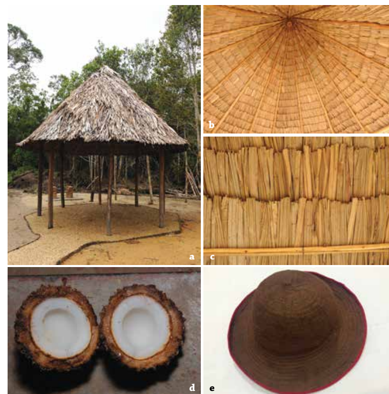
Figura 2. Algunos usos de Manicaria saccifera . a) Hojas usadas para techos, b-c) detalle del techado, d) frutos ocasionalmente usados como alimento o medicina, e) sombrero elaborado con la bráctea peduncular.

Estructura demográfica. Para evaluar de forma rápida y preliminar el posible impacto de la cosecha de brácteas en las poblaciones, entre diciembre de 2009 y enero de 2010 se estudió la estructura de las poblaciones en dos áreas de condiciones ambientales similares y con palmares de M. saccifera de aspecto muy parecido, pero con diferente manejo: un palmar de cabecinegro sometido a extracción de las brácteas y otro donde no se realiza extracción. Para esto se establecieron aleatoriamente 30 transectos de 5 x 50 m, 15 de éstos se realizaron en un palmar cerca de San Isidro, de donde provienen la mayoría de las brácteas comercializadas en Quibdó,